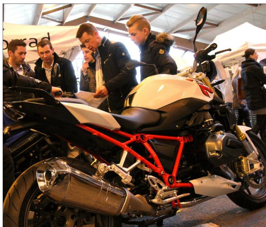
Le Salon du 2-Roues est l'occasion de découvrir les nouveautés en matière de bécanes.

La 23 e édition du Salon de la moto organisée ce week-end par les Cow riders a été moins fréquentée que l'an dernier. Une des raisons est la météo pluvieuse et venteuse qui a dissuadé plus d'un motard à sortir sa bécane. Le plus heureux, c'est le gagnant de la BMW F 800 R.