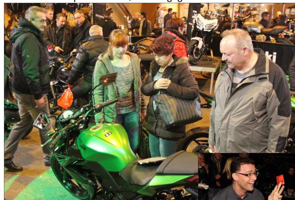
C'est aussi une vitrine pour les concessionnaires, équipementiers, accessoiristes, etc.