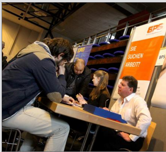
Les lycéens sont invités demain à Charles-Jully de Saint-Avold à inventer l'entreprise de demain.

Source inatrisable d'intelligence collective, depuis 76 ans, le CJD n'a cessé d'apporter des réponses de terrain aux enjeux sociétaux, notamment en termes d'emploi, en diffusant auprès de ses adhérents dirigeants d'entreprise les outils pour se former, échanger et expérimenter.